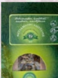
NAISTETEE 15g kortsleht, hobumadar, raudrohi, naistepuna

See tee annab eestimaiste puude väge ja jõudu.