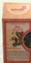
ÕNNE TEE 15g Meliss, monarda, metsmaasika ürt

Eriti hõrgu maitsega tee, mis avab su tundemaailma peenemad tajud.