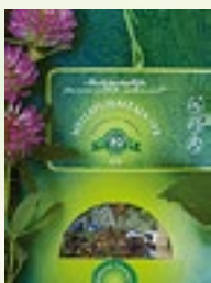
MEELEPUHASTAJA 15g punane ristik, õunmünt

See tee aitab suurendada tundlikkust, teadlikkust ja vastuvõtuvõimet, tõhustab õppimist, lisab inspiratsiooni ja ideid.