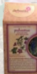
PUHASTUS 15g Kassinaeri õied, pune lehed ja õied

Soe ja rahulik tunne valgub sinusse. Kaovad ärevus ja kärsitus, mis asenduvad keskendumisvõime ja heade ideedega.