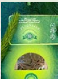
PUUJÕUTEE 15g männikasvud, kuusekasvud, kaselehed

Parim tee organismi tugevdamiseks, et haigused ligi ei pääseks.