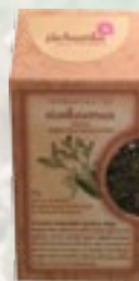
SISEKAEMUS 15g Liivatee, angervaksa lehed ja õied

See tee teeb südame rõõmsaks ja avab meeled, et saaksid nautida ümbritsevat maailma ja olla selles õnnelik.