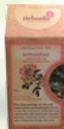
ARMASTUSE TEE 15g Metsmaasika ürt, kibuvitsa õied, lehed, marjad

Eriti hõrgu maitsega tee, mis avab su tundemaailma peenemad tajud.