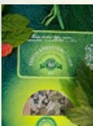
TERVES KEHAS TERVE VAIM 15g vaarikas, must sõstar, meliss

See tee aitab suurendada tundlikkust, teadlikkust ja vastuvõtuvõimet, tõhustab õppimist, lisab inspiratsiooni ja ideid.